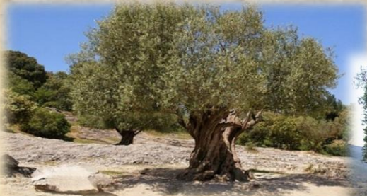
DE WILDE OLIJF